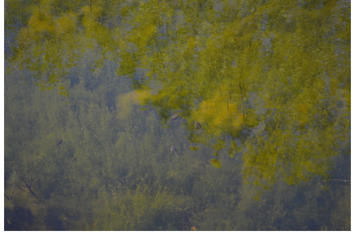
Tétards de Pélobate cultripède , espèce protégée au niveau national et à fort enjeu de conservation, le 19/04/2017.