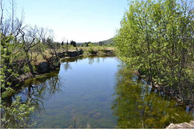
Vers l'Estang, le 19/04/2017 par Jérémy Cuvelier.