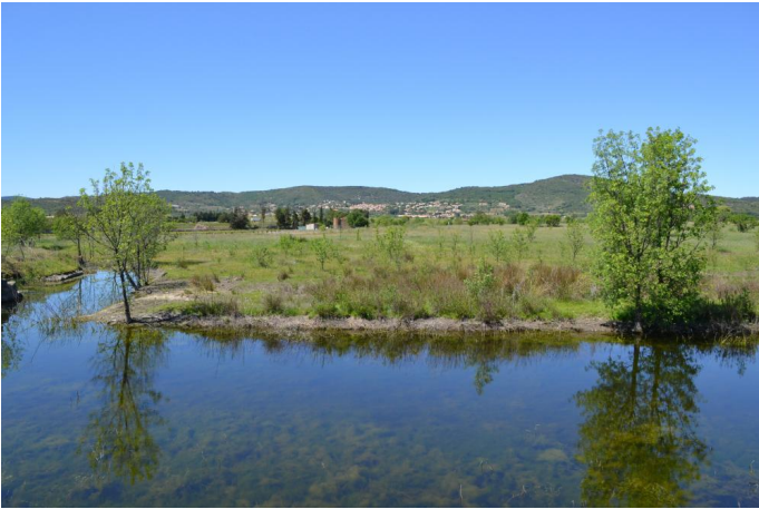
, le 19/04/2017 par Jérémy Cuvelier.