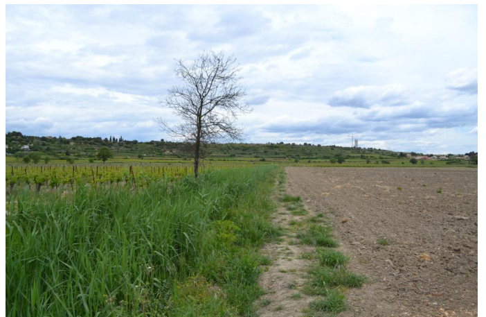
Fossé latéral non retenu dans l'inventaire à cause des fortes contraintes agricoles (possibilité de restauration), le 03/05/2017 par Jérémy Cuvelier.