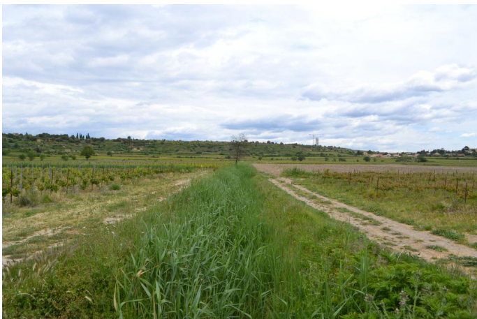
, le 03/05/2017 par Jérémy Cuvelier.