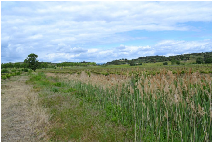
, le 03/05/2017 par Jérémy Cuvelier.