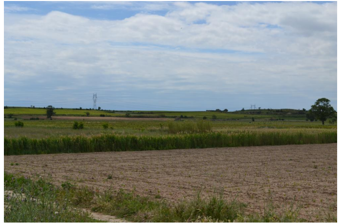
Fossé de Mayral vers la Plaine de l'Estang, le 03/05/2017 par Jérémy Cuvelier.