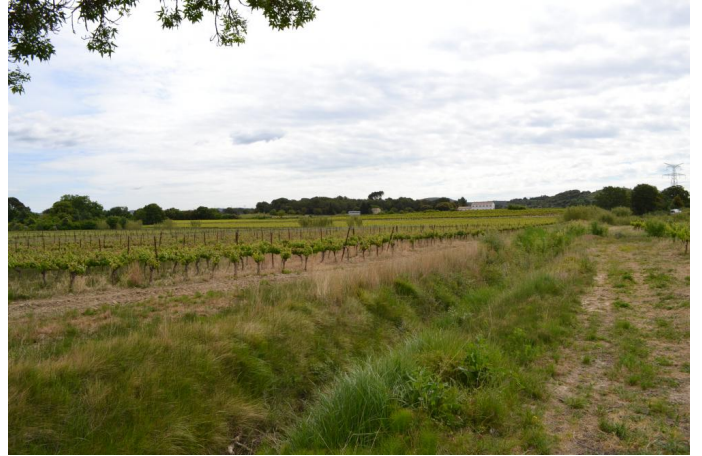
, le 03/05/2017 par Jérémy Cuvelier.