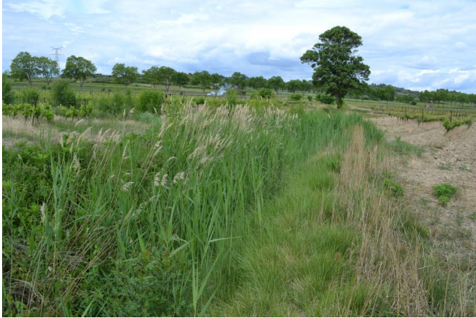
Fossé des Yeux vers Plaine de l'Estang, le 03/05/2017 par Jérémy Cuvelier.