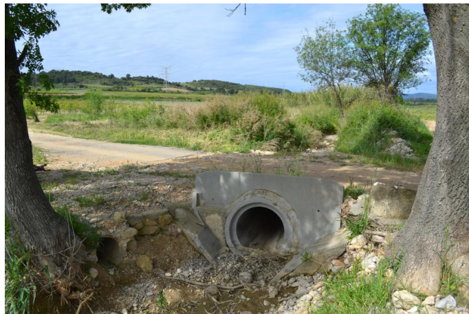
Passage busé sur le ruisseau du Paravel, le 03/05/2017 par Jérémy Cuvelier.