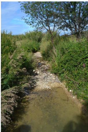
Vers les Fiaux, le 03/05/2017 par Jérémy Cuvelier.