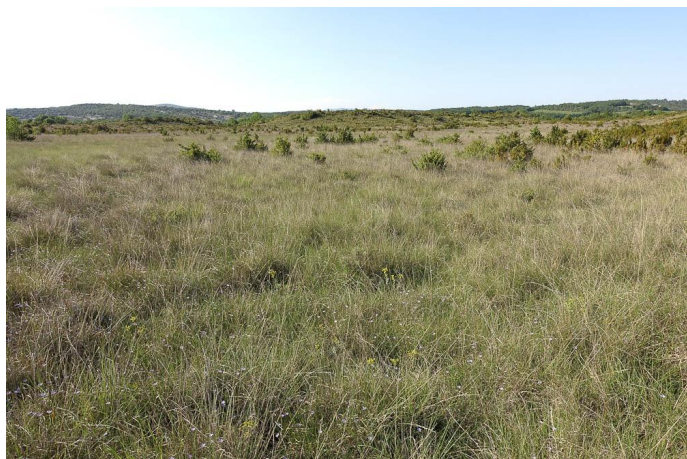
Prairie humide à Molinie., le 26/05/2017 par Jean-Laurent Hentz.