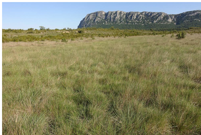
Prairie humide à Molinie sous le Pic Saint-Loup., le 26/05/2017 par Jean-Laurent Hentz.